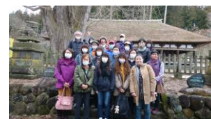
会津・新宮熊野神社前にて