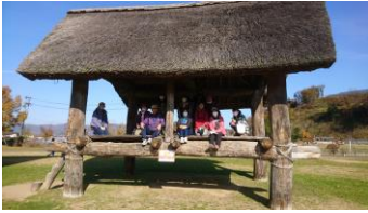
じょーもびあ宮畑にて