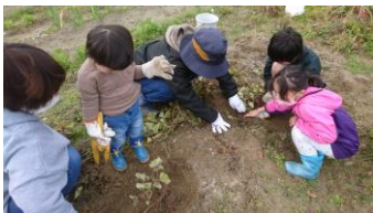
森のようちえんで芋ほり体験