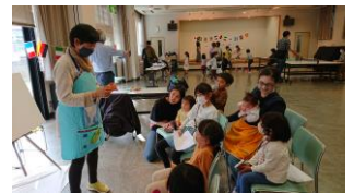
紙芝居も登場 ゲーム大会