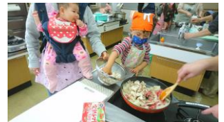
赤ちゃんもハヤシライス作り