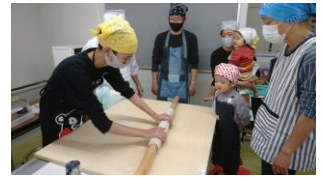
ハラクッチーでそば打ち

ハイキングでは「下郷町観音沼と天栄村羽鳥湖ハイク」を、ウォーキングでは福島市じょーもびあ宮畑の見学をしてから文知摺観音まで歴史散策をしました。