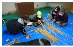
楽しかったしめ縄作り