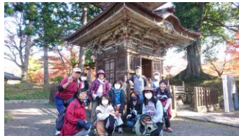
文知摺観音・多宝塔前にて