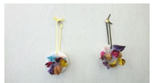
9月エール・アロマオイルのアイテム作り