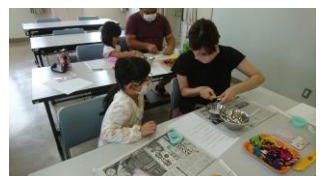
親子でアイテム作り