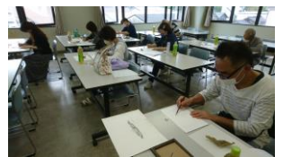
9月エール・木の葉デッサン