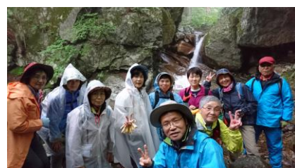
6月の大玉村遠藤ヶ滝は杉田川沿いの清々しい散策路でした

★詳しくはホームページで、 あだたら青い空 で検索するか、 https://www.adatara-aoisora.com/ NPO法人あだたら青い空 〒964-0074 二本松市岳温泉 2-20-11 電話 0243-24-1518