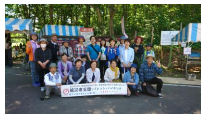
6月の南会津の高清水公園