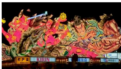
青森市ねぶた祭り