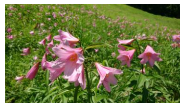
可憐なヒメサユリの花