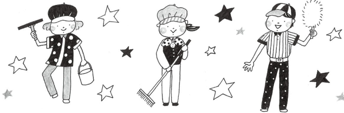
イラスト★ささきさとみ ( http://blog.goo.ne.jp/satomi343 )