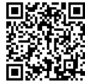
QRコード 土佐寮位置図