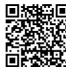
協会ホームページ QR コード