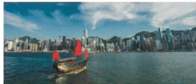
サンパン船乗船体験