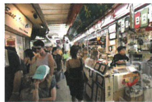
スタンレーマーケット

市内レストランにてお粥の朝食 アパディーンにてサンパン船体験乗船、レパルスベイ スタンレーマーケット散策、黄大仙にてお参り。昼食は飲茶をどうぞ。 ※途中、中国雑貨シルク店・寝具店へご案内します。DFSにて解散です。