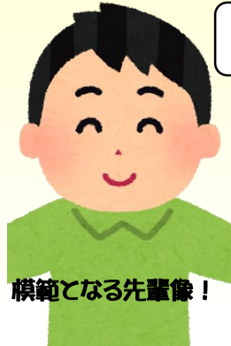
模範となる先輩像！