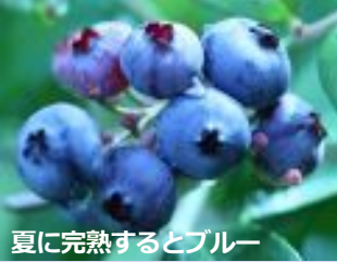
夏に完熟するとブルー