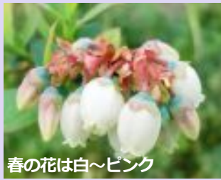
春の花は白~ピンク