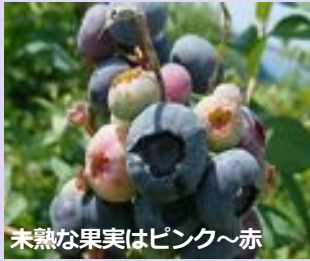
未熟な果実はピンク~赤