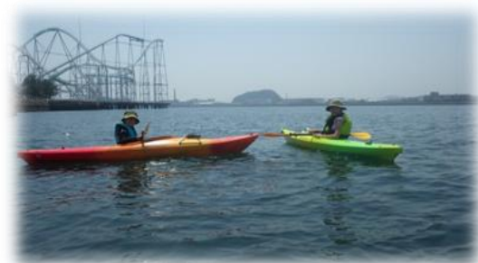
シーカヤック講習会 (大人向け)