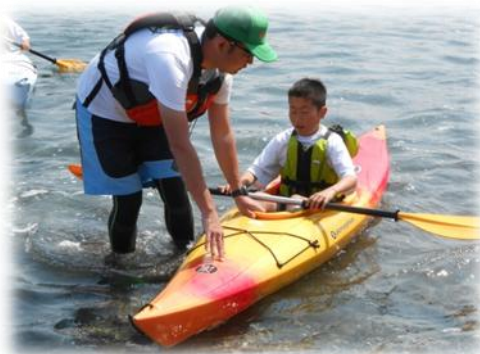
子どものカヌー講習会