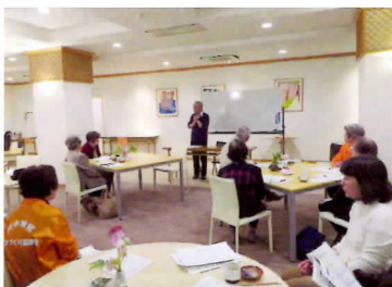
認知症を正しく理解するための講座を開催