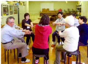
認知症予防ゲームリーダー養成講座を開催