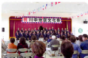
小学生合奏・合唱

第51回川中地区「文化祭」はあいにくの雨模様でしたが、多数の来訪者で賑わい大盛況のうちに終了いたしました。