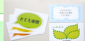
「はたかち」「かたちは」はJCCの登録商標です