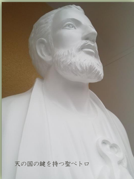
天の国の鍵を持つ聖ペトロ