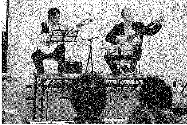
披露されたバンブーギターの演奏

三池竹虎は郷土玩具、三池初市のお土産として長く親しまれている。講座は同日とも午前10時から正午まで同地区館で行われ、2回で完成させる。受講は無料だが、材料費として300円必要。申し込み、問い合わせは同地区館(電話583343番)へ。