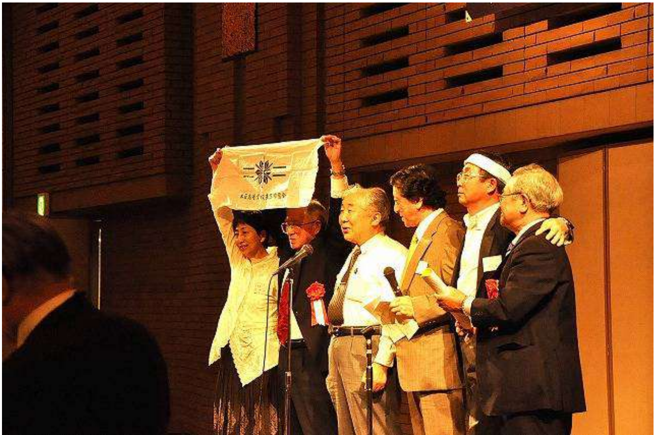
校歌斉唱を終え、元気一杯で明年の再会を期して