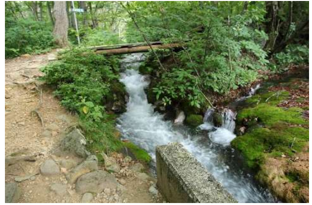
鳥海マリモ群生地、放水路