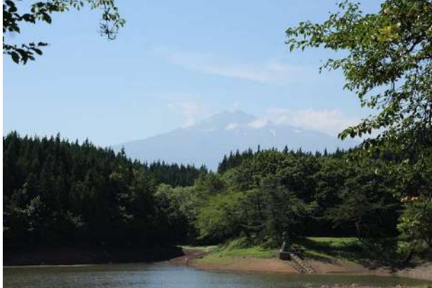
西由利原より鳥海山を望む