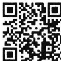
移住・定住応援 サイトQRコード

所 在 秋田県由利本荘市尾崎17番地 電 話 0184-24-6247 E-mail iju@city.yurihonjo.lg.jp 申込み 移住・定住応援サイトでご確認ください。