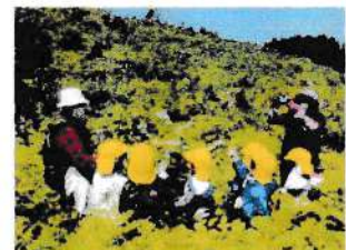
<地域の人と里山散策>