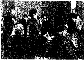
班の意見を全体に発表する様子