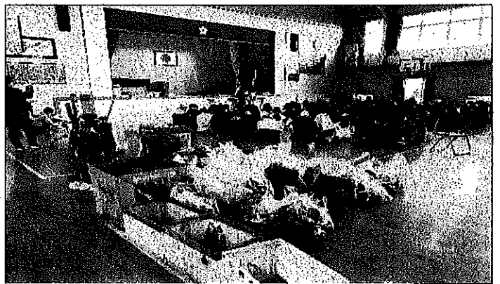
児童・大人により拾われたゴミ。小学校体育館