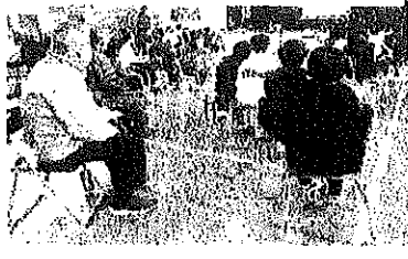
感想を発表する様子